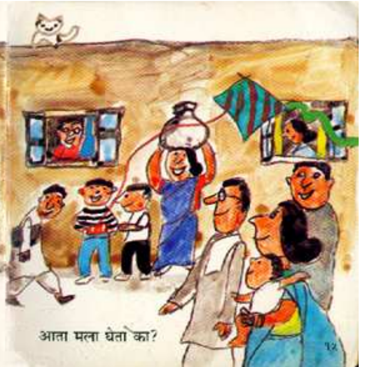
Will you take me now? क्या तुम अब मुझे लगे?