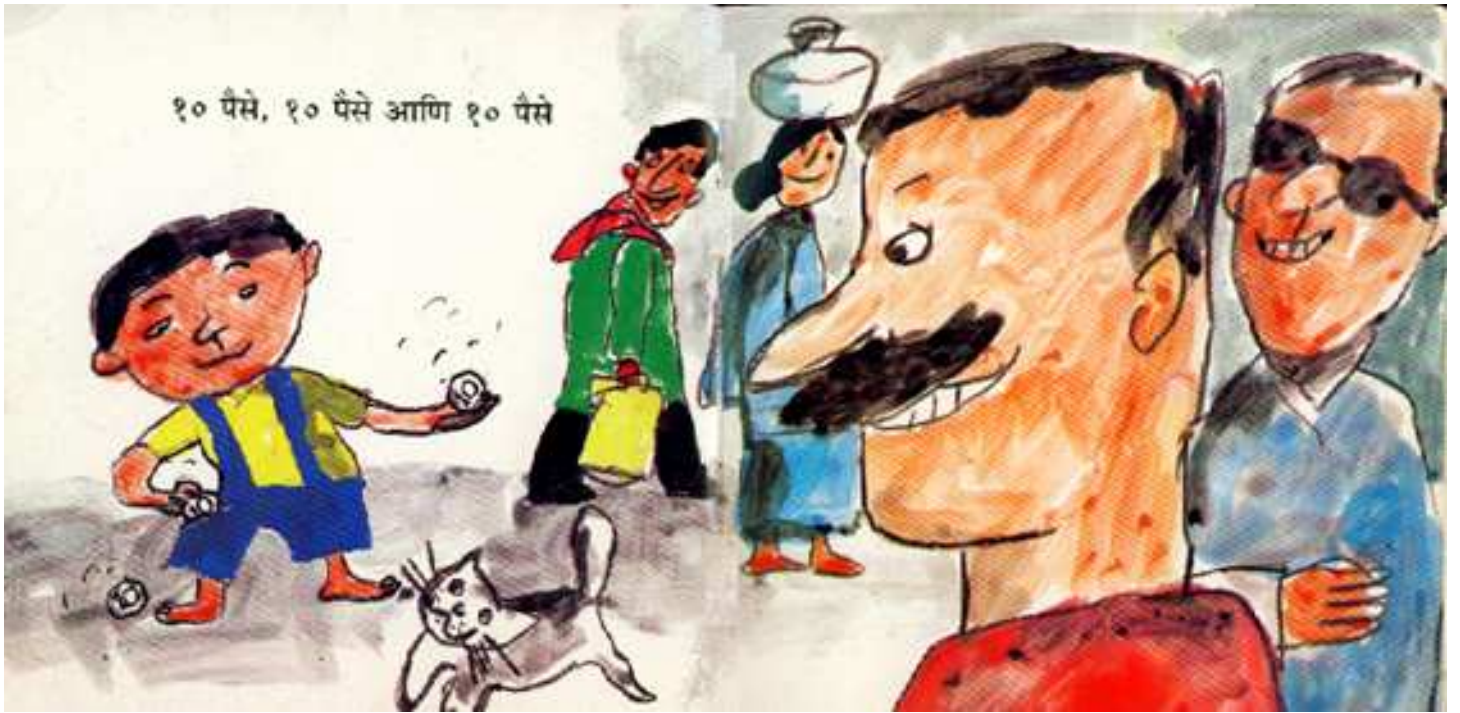
10 Paise, 10 Paise and 10 Paise दस पैसे, दस पैसे और दस पैसे