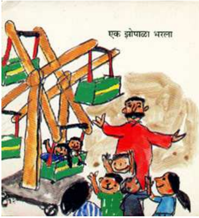
One basket got filled एक झूला भरा