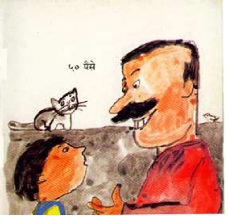
Fifty Paise पचास पैसे