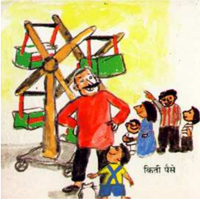
How much? कितने पैसे?