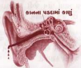
કાનમાંથી નીકળતો પાક