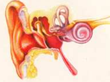
કાનની સામાન્ય રચના