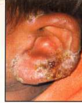
બહારના કાનમાં પાક