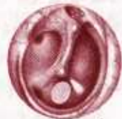
કાનના પડદામાં કાણું