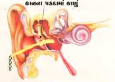
કાનમાંથી નીકળતો પાક