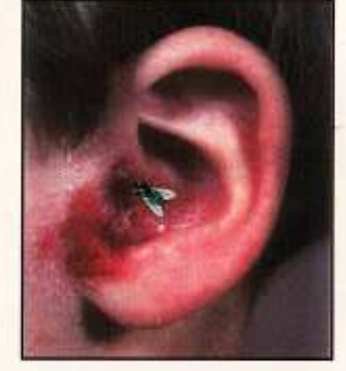
પાક પર બેઠેલી માખી