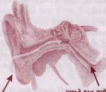
કાનમાંથી નીકળતો પાક