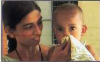
ચોખ્ખા રૂમાલથી નાકને લૂછવું