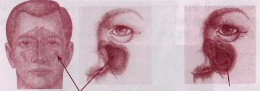
ચહેરામાં આવેલા સાયનસ જેમાં હવા હોય