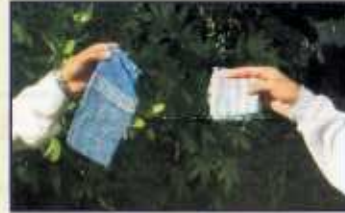
જુદો જુદો રૂમાલ વાપરવો