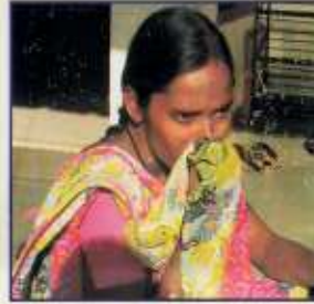
પહેરેલા કપડા વડે નાક સાફ કરવાથી