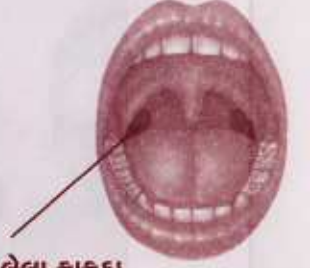
ગળાનાં ફુલેલા કાકડા

ગળાના કાકડા (ટોન્સિલ) ગળાની પાછળના ભાગમાં બંને બાજુ આવેલા હોય છે, જે મોં ખોલી આઆઆ.... બોલવાથી જોઈ શકાય છે. જ્યારે નાકના કાકડા (એડિનોઈડ) નાકની પાછળના ભાગમાં આવેલા છે, તે જોઈ શકાતા નથી. ગળા અને નાકના કાકડાં શ્વાસ લેતી વખતે હવા જ્યાંથી અંદર શ્વાસનળીમાં દાખલ થાય તેના પ્રવેશદ્વાર આગળ આવેલા છે. કાકડાં ખાસ કરીને નાના બાળકોને શરૂઆતના ૩-૪ વર્ષ ખૂબ કામના હોય છે. આ સમયે તેમનામાં રોગ સામે લડવાની શક્તિ બરાબર વિકસી હોતી નથી. તેથી તે સમયે કાકડા શરીરને રક્ષણ આપે છે.