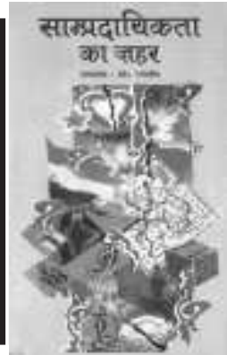
साम्प्रदायिकता का जहर