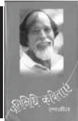
जाति का जंजाल